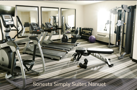
Sonesta Simply Suites Nanuet