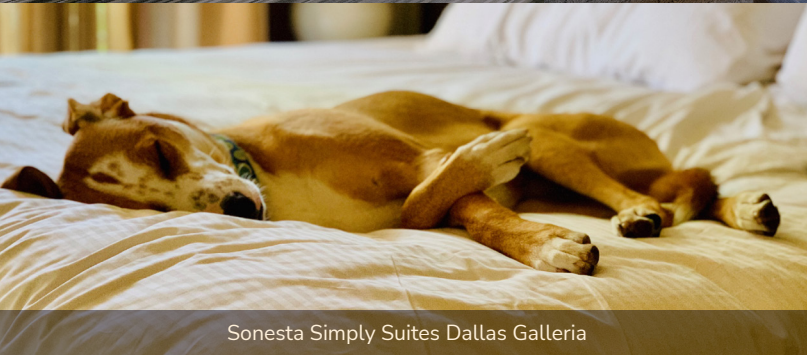
Sonesta Simply Suites Dallas Galleria