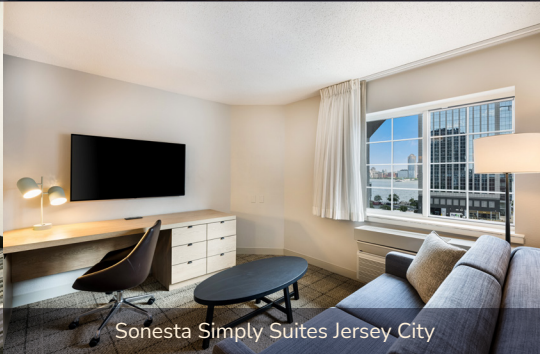
Sonesta Simply Suites Jersey City