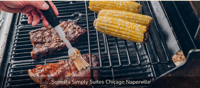
Sonesta Simply Suites Chicago Naperville

8ª EMPRESA | Más de 1.100 propiedades | 13 marcas | 1 PREMIADO Hotelería MÁS GRANDE de los EE.UU. | Más de 100.000 habitaciones | 9 países | programa de fidelización