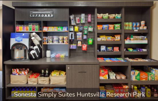
Sonesta Simply Suites Huntsville Research Park