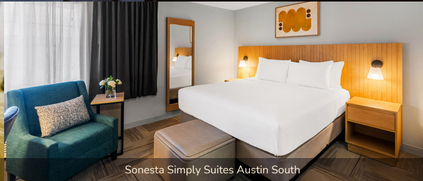
Sonesta Simply Suites Austin South