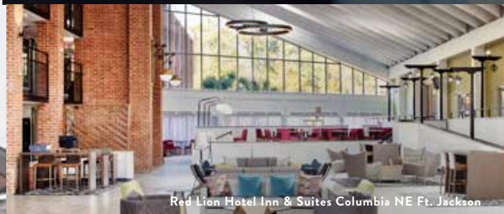
Red Lion Hotel Inn & Suites Columbia NE Ft. Jackson