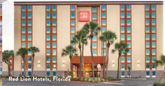
Red Lion Hotels, Florida