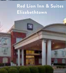
Red Lion Inn & Suites Elizabethtown