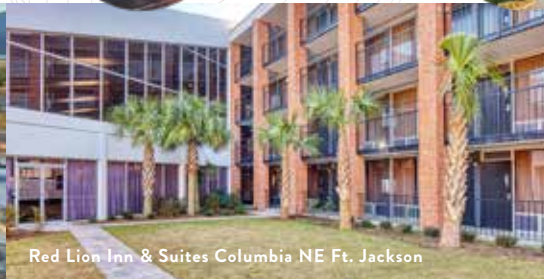
Red Lion Inn & Suites Columbia NE Ft. Jackson