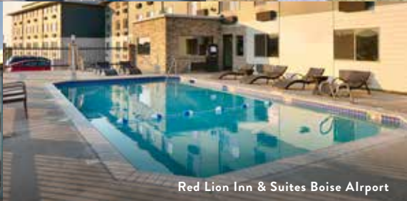
Red Lion Inn & Suites Boise Airport