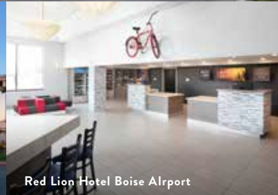
Red Lion Hotel Boise Airport