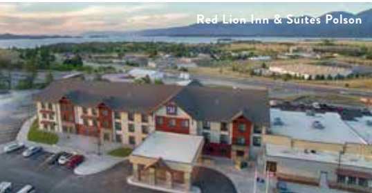
Red Lion Inn & Suites Polson