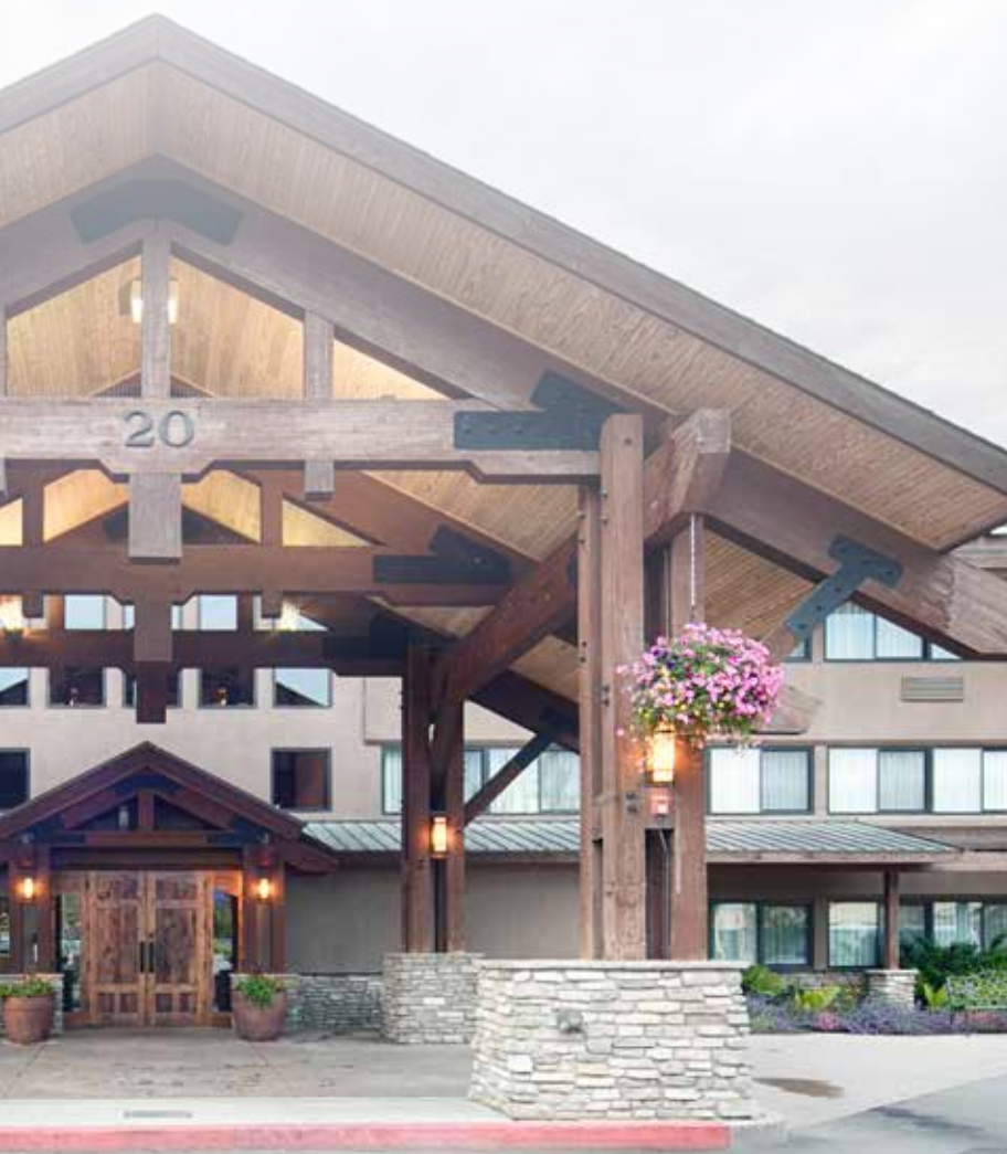
Red Lion Hotel Kalispell

Temos orgulho de ser pioneiros nesse caminho de inovação, especialmente quando se trata de gerar mais oportunidades de negócios.