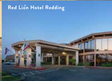
Red Lion Hotel Redding