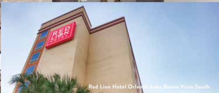
Red Lion Hotel Orlando Lake Buena Vista South