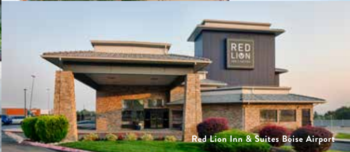
Red Lion Inn & Suites Boise Airport