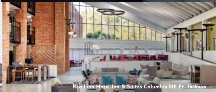
Red Lion Hotel Inn & Suites Columbia NE Ft. Jackson